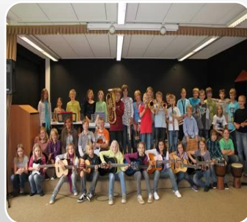
Musik & Kunst